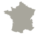
Ensemble des Français